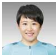
かじわら ゆうみ 梶原 悠未氏

元サッカー選手(いばらき大使) 1975年茨城県日立市生まれ。高校卒業後に鹿島アントラーズに加入し、チームの3冠獲得等の原動力となる。2002FIFAワールドカップでは日本代表に選出され、ベルギー戦でゴールを決めるなどベスト16に貢献する。2015年12月に現役引退。