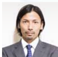
すずき たかゆき 鈴木 隆行氏

元サッカー選手(いばらき大使) 1975年茨城県日立市生まれ。高校卒業後に鹿島アントラーズに加入し、チームの3冠獲得等の原動力となる。2002FIFAワールドカップでは日本代表に選出され、ベルギー戦でゴールを決めるなどベスト16に貢献する。2015年12月に現役引退。